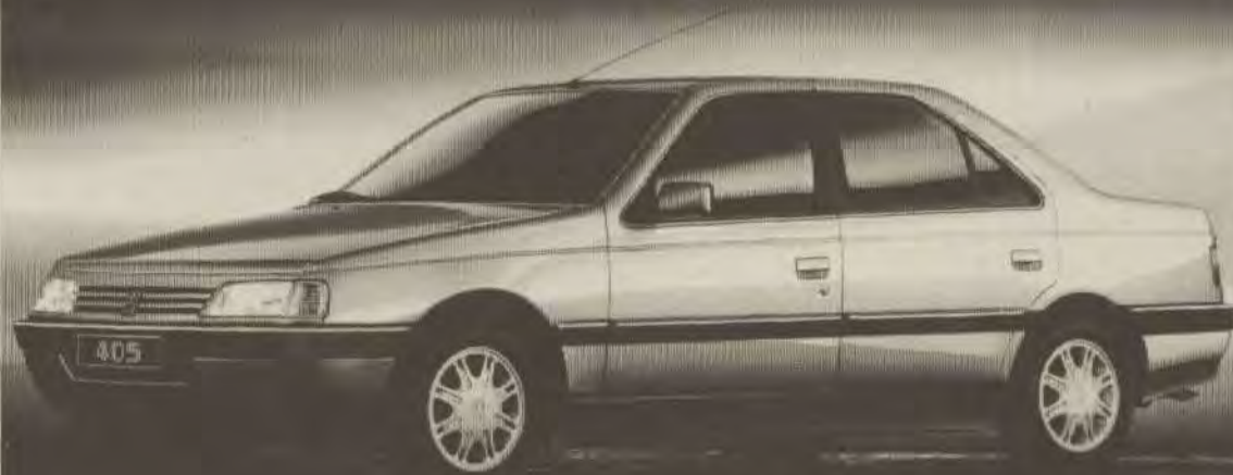
Peugeot 405. Vanaf 26.400,-.