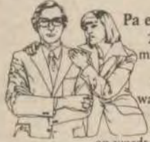
Pa en Ma

Sparen met het Spaar-Extra-Premie boekje, dat geeft extra veel rente!