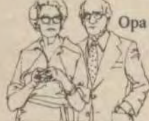
Opa en Oma

Iedereen spaart zoals het hem of haar 't beste uitkomt. Begin er mee tijdens de Spaarweek, de Rabobank heeft ook voor u de beste spaarvorm!