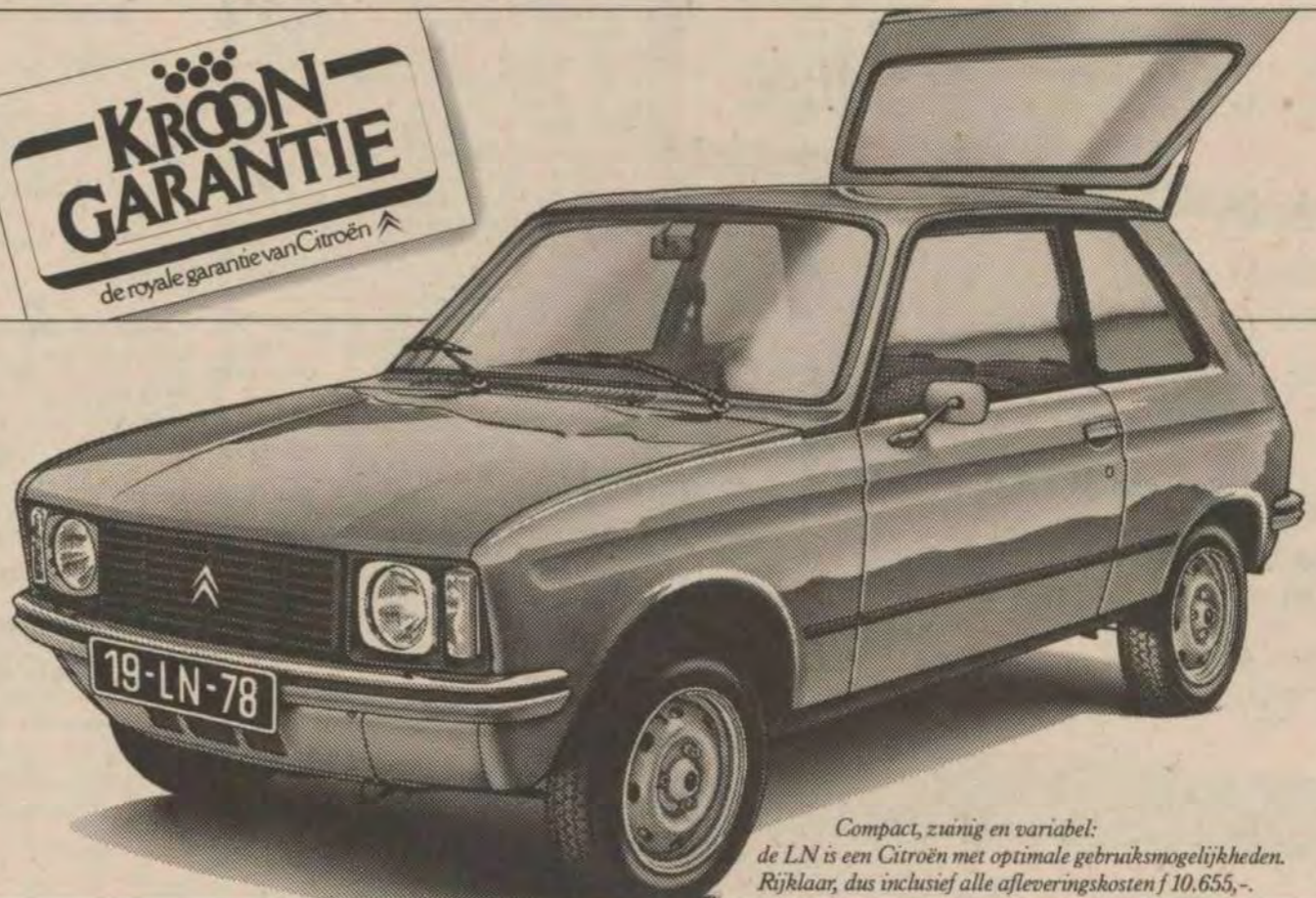
Compact, zuinig en variabel: de LN is een Citroën met optimale gebruiksmogelijkheden. Rijklaar, dus inclusief alle afleveringskosten f 10.655,-.