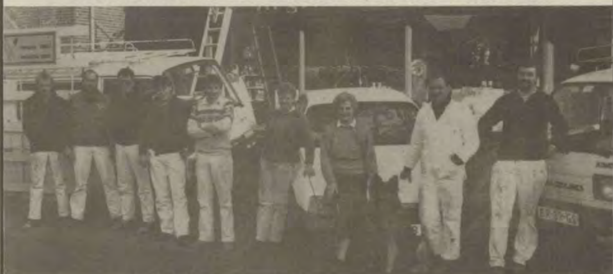
Prettige Kerstdagen en een Gelukkig Nieuwjaar.