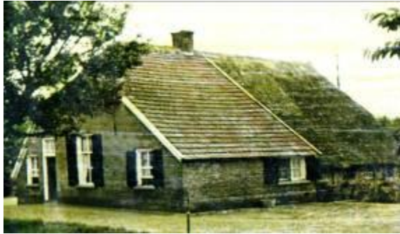
Dennenkamp 1953 1

Op een rustig plekje tussen de Wildenborchseweg, Giezenkampweg, Mosselseweg, Reeoordweg en Beltenweg ligt, 's zomers diep verscholen tussen hoge maisvelden, boerderij de Dennenkamp (Giezenkampweg 4 1 ). Echter, zo stil en vredig als het er nu is, zo woelig waren de eerste jaren van dit plaatsje, nadat het was afgescheiden van het nabijgelegen Giesenkamp .