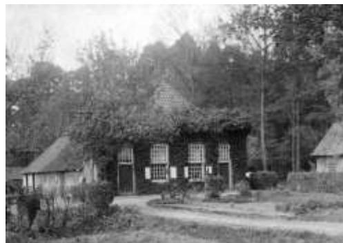
Het oude Schoolhuis : 1797-1957