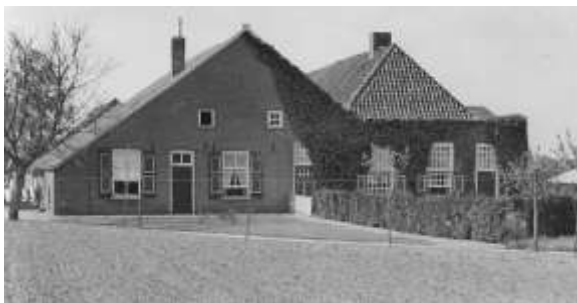
Linker gedeelte: 1912- 1957 25