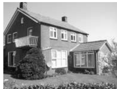
Het nieuwe Schoolhuis : 1958 25