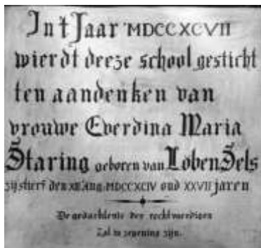
Herinneringsplaque uit 1797