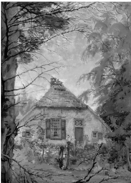
< 1956 De Klokkenhof 1960 >