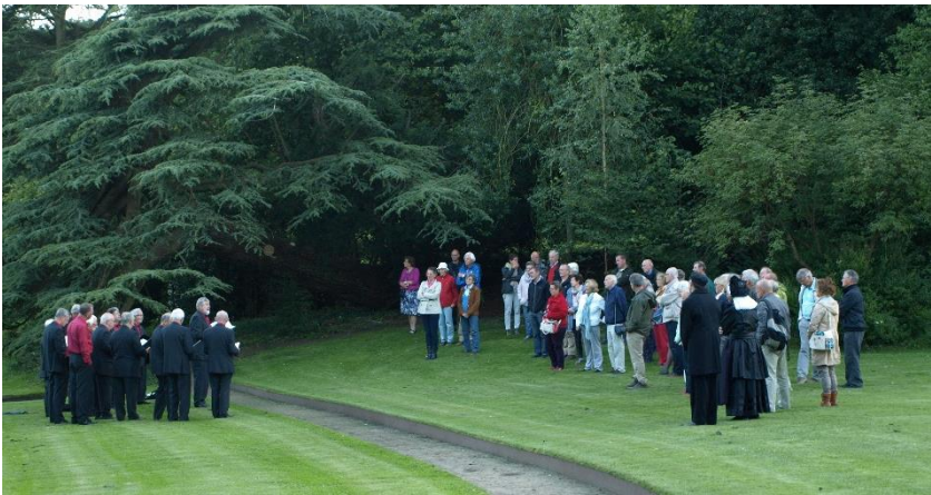
In de tuin, bij de Libanonceder, luisterden we naar de IJsselzangers