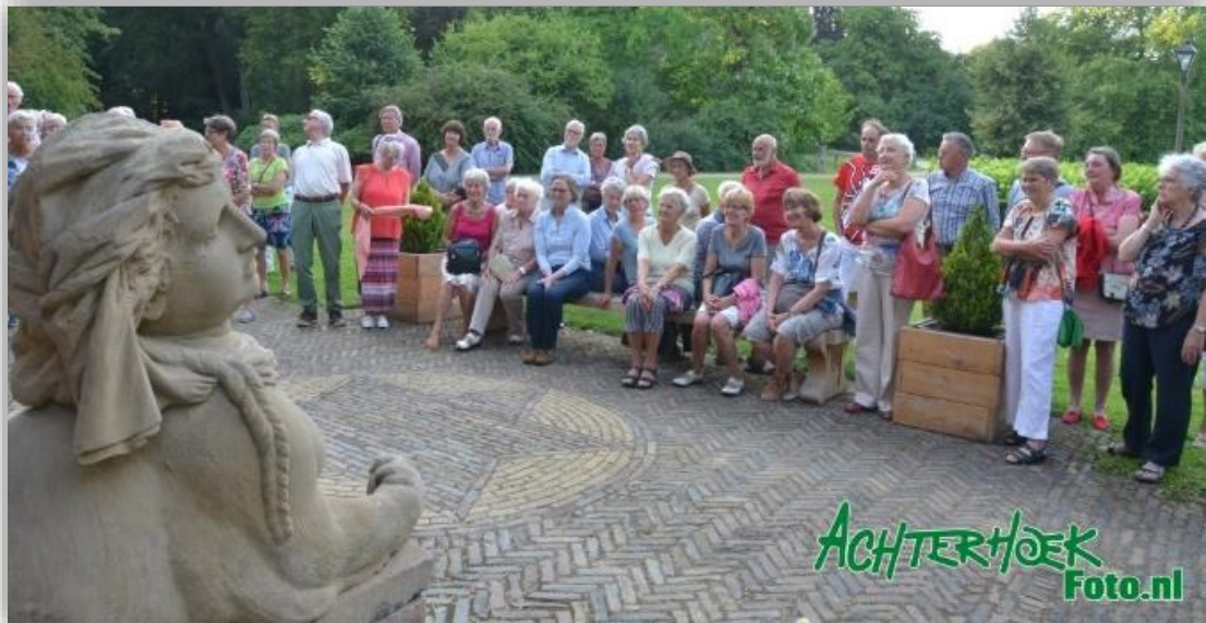
De beelden in de tuin zijn dit jaar gerenoveerd