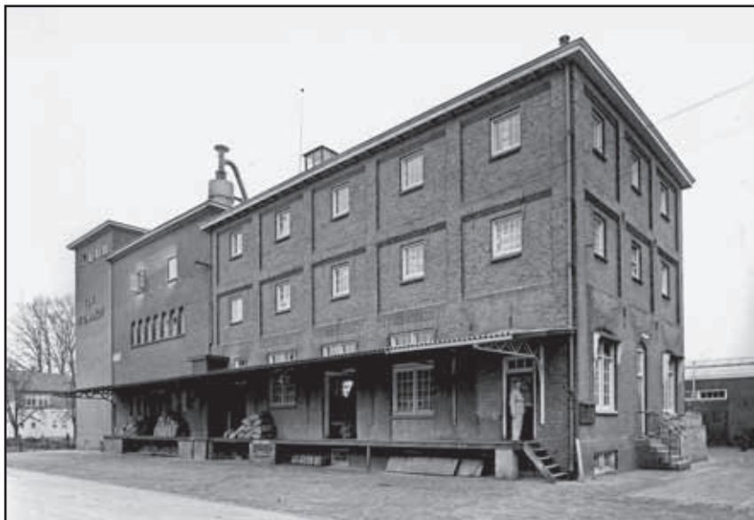
Vooraanzicht van de coöperatie De Eendracht, met de eerste molenaar bij de ingang (?). De coöperatie is in 1915 opgericht en in 1915 is ook de woning ernaast gebouwd.

In het door Oud Vorden in 2006 uitgegeven boek BEDRIJVIGHEID IN VORDEN IN DE 20E EEUW misten we een bijdrage over de coöperatie De Eendracht. We zijn op onderzoek uitgegaan naar de archieven van deze voormalige coöperatie, die als gevolg van de vele fusies uiteindelijk bij de coöperatie in Delden (Ov.) gevonden werden.