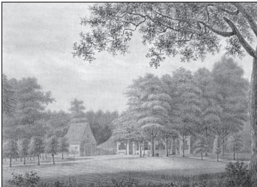
Het oude Enzerinck +/- 1830