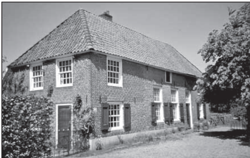
De herberg de Wientjesvoort; vanouds een pleisterplaats voor voerlieden.

Door de familie Wagenvoort is en wordt veel onderzoek gedaan naar haar voorgelacht. De Wagenvoorts zijn daartoe verenigd in de Stichting familie Wagenvoort, die de resultaten van de onderzoeken (in eigen kring) publiceert in het blad De Wagenschouw. Met hun toestemming worden daaruit nu enige feiten en verhalen in de Kronyck opgenomen.