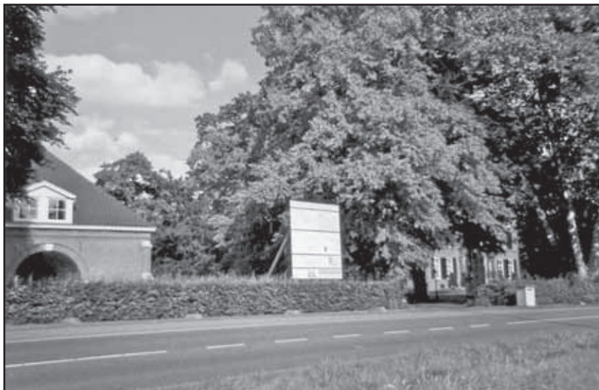
De boerderij de Bult stond ongeveer achter het witte bord op de foto.