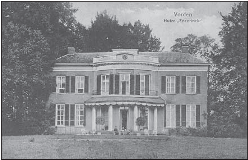
Het Enzerinck 19 10