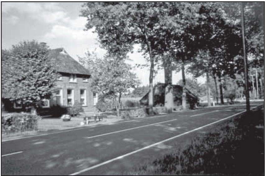
Links de boerderij Nieuw-erve. Klein Veltkamp stond waarschijnlijk rechts hiervan, richting Kranenburg.