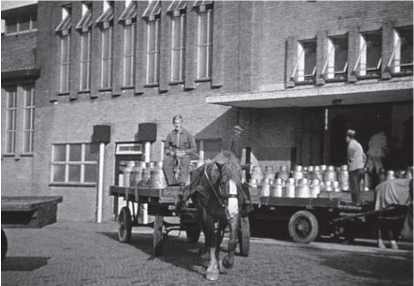
Op disse foto zeet ielle een paar mansleu met peerd en wagen vol met melkbussen bie de Botterfabriek ('autowagens' neumd'n zee die), zoas zee toendertied uut-emonsterd waarn.

De fabriek, die dus belang had bie geregelde melkanvoer, besteedd'n onder gegadigden de zogenaamde melkritten an. 't Gebied van Vorden dat leveringsplichtig was an de botterfabriek worden hiertoe in wiken in-edeeld. Veur elk gebied kon der in-eschreven worden deur een, en ok wel deur meer personen. Die aanbesteding vond jaorlijks plaats in 't Nutsgebouw. Degene die volgens de fabriek de beste, dus de leegste pries had, werd an-esteld als melkvaarder en bleef dat veur een jaor. Hee mos dan de melk van een antal boeren naor de fabriek brengen en dan ok dezelfde margen de läöge bussen weer terugge brengen. Dat werk was äözen, waor de keerls trouwens wel erg hendig in waarn. Met een flinken zwaai de bussen (40