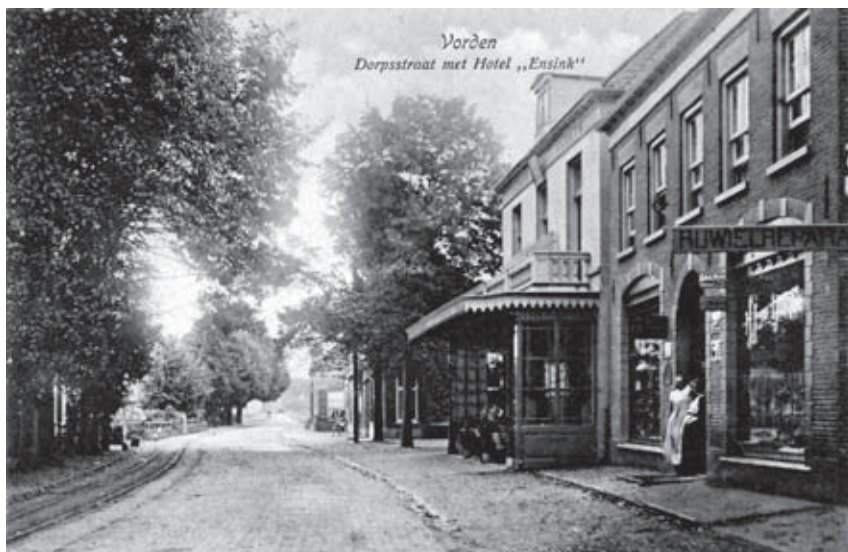
Het pand van Ter Huerne – het linker deel van het dubbele pand vóór Hotel Ensink (nu Bakker) – zoals afgebeeld op een oude ansichtkaart.

smelten, dan het vet afgieten, zodat het bezinsel achterblijft. Heerlijk om daarin te frituren.