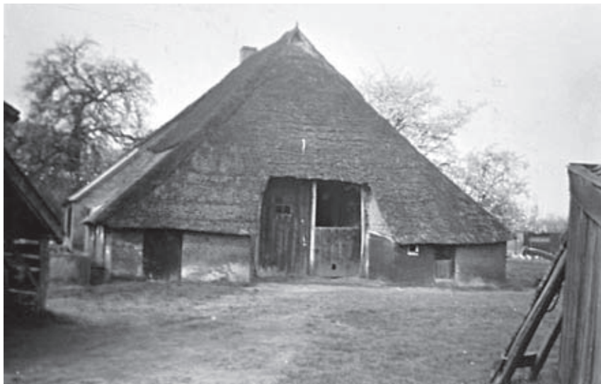
Het oude Maatman (foto dateert waarschijnlijk van omstreeks 1870)