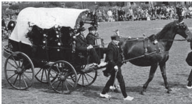
Zoals dat vroeger ging: Boerenbruifloft met De Knupduukskes. (foto in 1955 genomen tijdens een bezoek aan Oegstgeest).

Tegenwoordig is het ook erg handig als een buurman, die zelf ook een melkrobot heeft, even naar jouw melkrobot kijkt, als je eens even weg bent. Het spreekwoord “Een goede buur is beter dan een verre vriend” doet nog steeds opgeld!