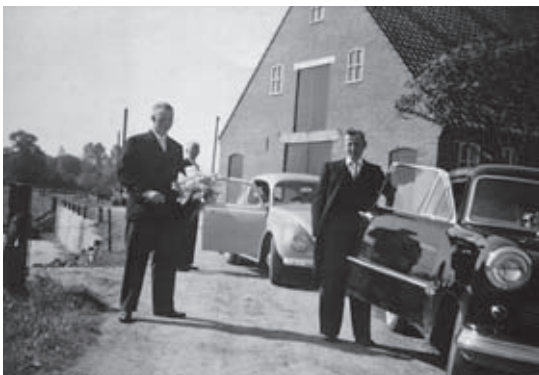
De bruidegom wordt door de burens opgehaald en naar het huis van de bruid gereden, waar zij wordt opgehaald, om vervolgens samen met de bruidegom naar het Gemeentehuis en, eventueel, kerk gebracht te worden.

Bij de uitvaart had de timmerman de leiding. Onder zijn leiding namen de burens de kist op en droegen deze over de deel naar buiten. Bij een huwelijk gingen men via de voordeur naar binnen, maar uitgedragen werd men over de deel, langs het vee naar buiten.