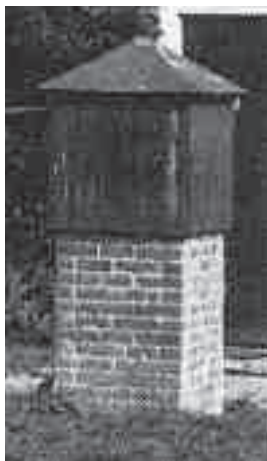
Pompen in diverse uitvoeringen (hout, steen, hout en steen, enz.)

In de iets mindere olde tied word'n die putte op-evolgd deur een pompe. Heel vake gebeur'n 't wel dat d'r een pompe eplaatst word'n op de waterputte. Zee wis'n dan zeker dat d'r water was. Ging dat neet zo gemakkelijk, of was de putte wat vergaon of, wat ok veurkwam, dat 't water van wat mindere kwaliteit was, dan mos d'r een buize de grond in, töt op een water-aor. De onderste buize was veurzien van geatjes, zodat daordeur 't (grond)water op-ezoagen kon word'n. Heel vake was der dan ok met een wichelroedeloper een goeie wateraor op-ezog. Op de pompebuize word'n vake een simpele handpompe ezet en der ummehen word'n dan een holten kaste eplaatst die vake weer op een stenen voet ston. De pompen van latere tied waar'n ok heel vake uut-evoerd in metselwerk, met een holten kop, zo-as op de foto's hiernäös.