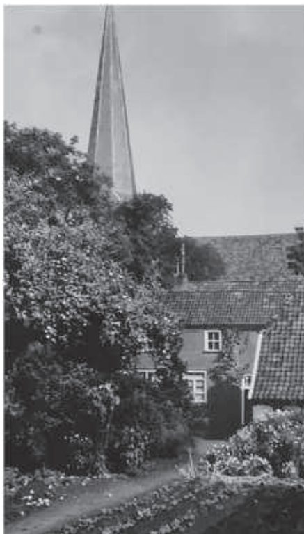
Achterzijde van Het Wapen van Vorden, rond 1920