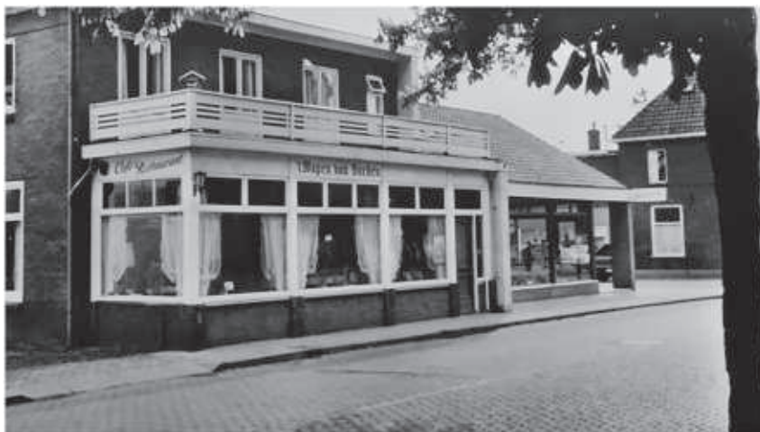
Het Wapen van Vorden rond 1968