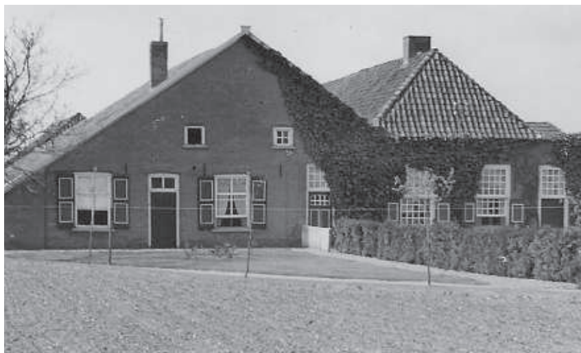
Schoolhuis met aangebouwde vaaltstal