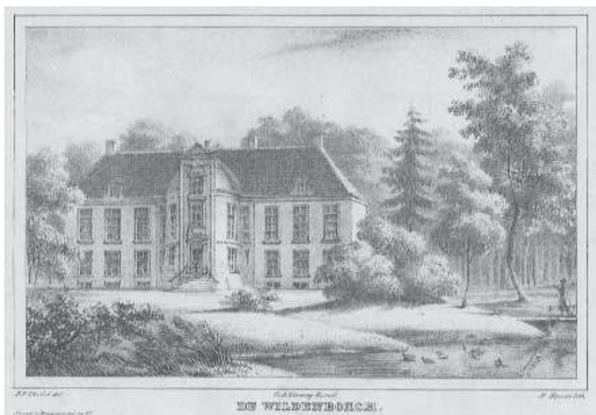
De Wildenborch in de tijd van Staring

uitgemaakt van de gemeente Laren, waar Barchem ook onder viel, en was Staring enkele jaren maire (burgemeester) van Laren.