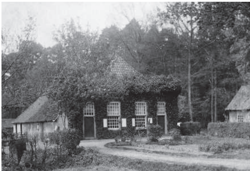
Het oude Schoolhuis 1797-1957