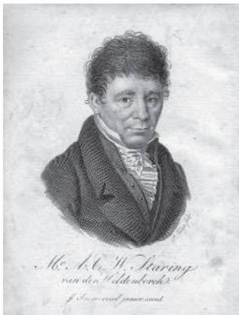
Uit: Nederlandsche Muzen-Almanak 1825

Dit was de openingszin van een bijdrage van J.A. Jolles in het jaarboek Bijdragen en Mededeelingen van de Vereeniging Gelre, deel XLIV (1941). Hoewel hij in 1840 overleed, blijft Staring in de Graafschap springlevend. Zijn leven en werken worden regelmatig herdacht.