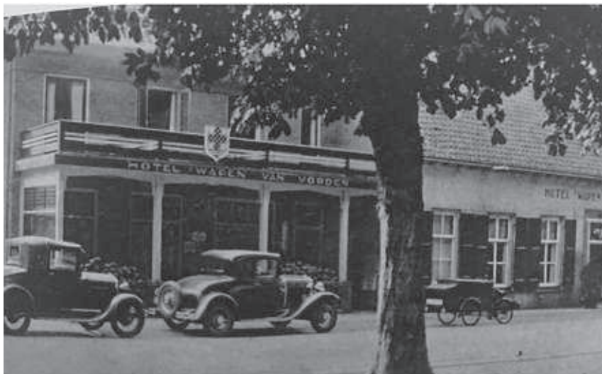
Hotel Het Wapen van Vorden, ca. 1925 (ten tijde van de stormramp van Borculo)

Gedurende de oorlogsjaren nemen Duitse officieren hun intrek in Het Wapen van Vorden en bespreken hier hoe de verdedigingslinie achter de IJssel op te werpen.