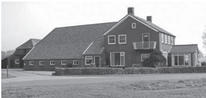
Schoolhuis met nieuw voorhuis 1958-heden (Gerard Klunder, 2016)

Om terug te komen op het schooltje, nadat deze ter ziele was gegaan zou het nog zo'n honderd jaar duren voordat de Wildenborchse kinderen weer in de eigen buurtschap naar school konden 27 .